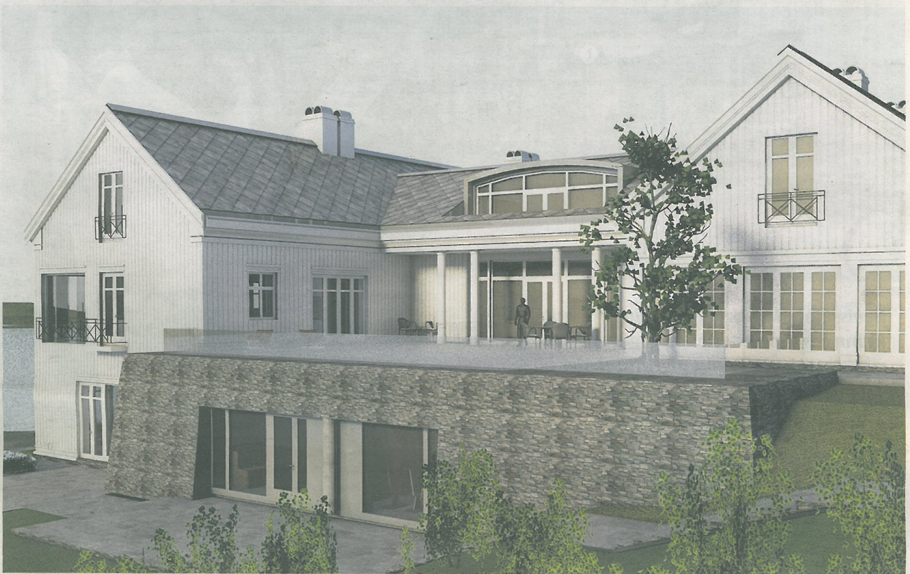
Vestsiden av huset er preget av god terrasseplass og godt med vinduer. Siden det er ganske flatt på tomta huset står på, vil det være gode solforhold. Illustrasjon: MEINICH ARKITEKTER