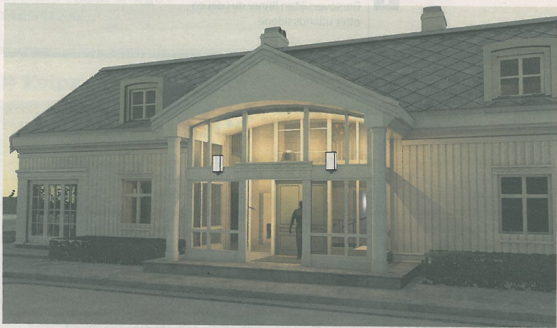
Bygges i tre: Illustrasjonen viser inngangspartiet ved gårdsplassen. Huset vil i hovedsak oppføres i tre og spille på den lokale byggeskikken i området med referanser til trønderlåna. Det vil imidlertid være et veldig moderne bygg, og får blant annet energi via jordvarme. ILLUSTRASJON: MENICH ARKITEKTER